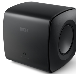
カーボン・ブラック