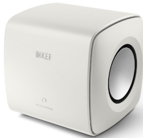
ミネラル・ホワイト